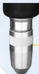
PIQUEUR VIS DOUBLE FILET