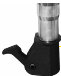
PIQUEUR À LOQUET